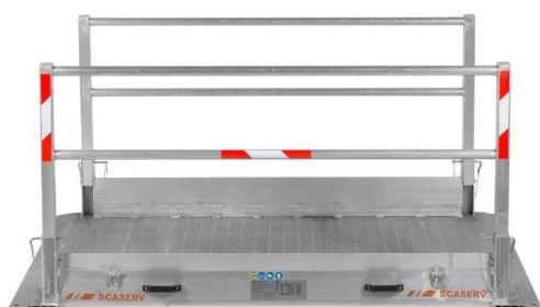
Lávka se zajištěným zábradlím připravena k použití